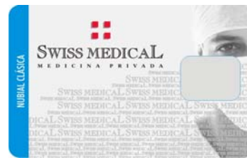
Cred. Nubial Clásica