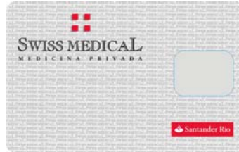
Cred. Plata SMG Santander