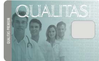
Cred. Qualitas Premium