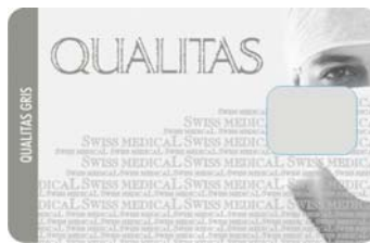
Cred. Qualitas Gris